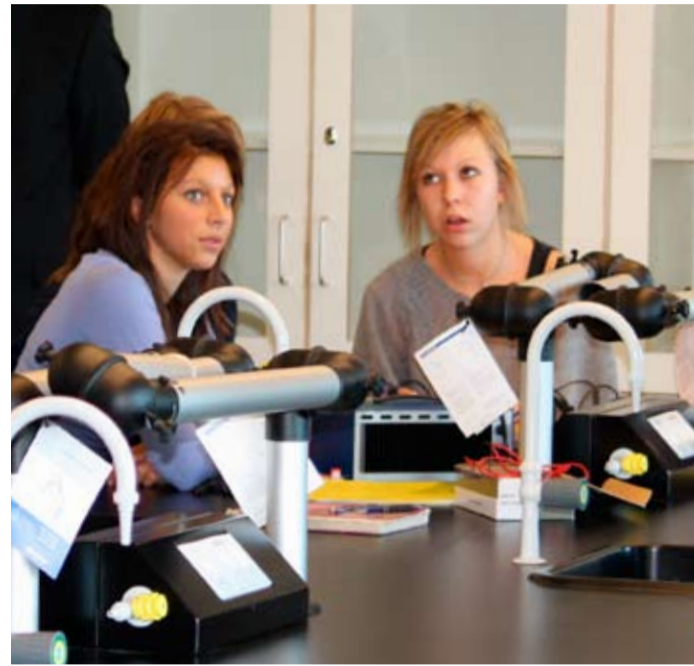
Sådan kan et naturfagslokale se ud når skolebestyrelsen har forfulgt alle muligheder for at få bevillinger.

– Vi var hele tiden fremme i skoene, sørgede for at få avisomtale af vores andre initiativer på skolen, vores madordning, antimobbeindsatsen osv. og benyttede flere lejligheder til at invitere ministre ud. Og vi pressede hele tiden på over for kommunen. Presset gav pote, og vi er nu i 2010 oppe på en samlet bevilling på 26 mio. kr.