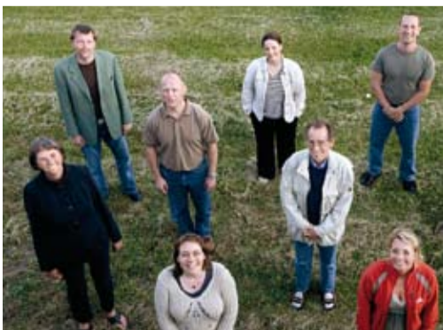
Landets første trivselsambassadører blev udpeget på Skelgårdsskolen i Kastrup.

Har jeres skole indført trivselsambassadører? Ellers var det måske en idé at gøre det. Trivselsambassadørerne er typisk to forældre fra hver af skolens faser (indskoling, mellemtrin og udskoling) som følger med i trivslen inden for deres afdeling og kommer med forslag til arrangementer og initiativer der løfter trivslen, og denne rolle har været afprøvet på flere hundrede skoler i de sidste to år. Hvis skolebestyrelsen vælger en af forældrerepræsentanterne til at være ansvarlig for området og indgå i gruppen af trivselsambassadørerne, kan trivselsambassadørernes initiativer koordineres med skolebestyrelsens arbejde med værdiregelsæt, ordensregler, handlingsplan mod mobning m.m. Også på dette område kan I bestille materialer fra Skole og Forældre, eller I kan trække på instruktører der kan holde kurser for forældrene som opstart på ordningen.